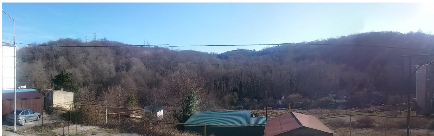
Панорамный вид на участок со стороны ул. Рязанская. Городские коммуникации по границе участка.

Участок имеет 2 удобных подъезда – въезд с западной стороны непосредственно из жилого массива пос. Детляжка и въезд на высшую точку участка с восточной стороны напротив пансионата «Шексна».