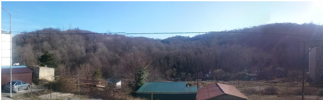
Вид на участок со стороны ул. Рязанская.

Пос. Детляжка - это маленький живописный район в Лазаревском районе неподалеку от Сочи. Именно отсюда начинается климатическая зона влажных субтропиков. Благодаря влиянию Черного моря и высоких гор Кавказа в Детляжке продолжительное лето и практически нет зимы.